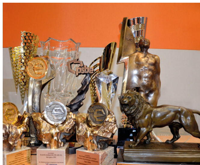
Wyróżnienia targów ENERGETAB cieszą się w branży wysokim prestiżem