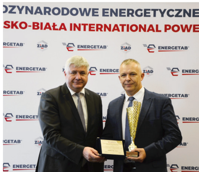
Pucharem PTPIREE nagrodzono firmę ARINET za produkt Watucab Ψ