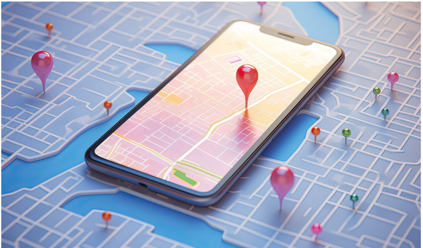
System GPS jest utrzymywany i zarządzany przez Departament Obrony USA . Korzystać z jego usług może w zasadzie każdy – wystarczy tylko mieć odpowiedni odbiornik GPS

odczekuje indywidualnie określony czas, po czym retransmituje ten sygnał. W zależności od położenia odbiornika, a dokładniej od jego odległości od poszczególnych radiolatarni, zmieniają się odstępy czasowe między odebranymi przez niego sygnałami.