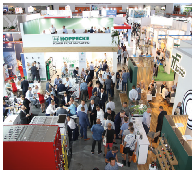
W targach wzięło udział ponad 430 wystawców